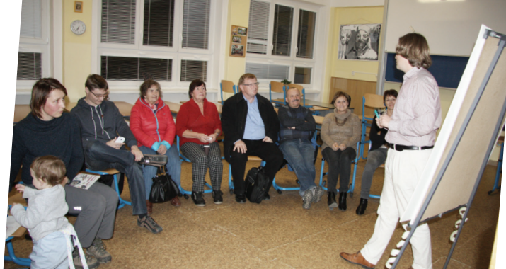
Ke kvalitě diskusí v pracovních skupinách přispěli facilitátoři/rky, kteří zaznamenávali všechny náměty a postarali se, aby ke slovu přišli všichni, kdo měli zájem