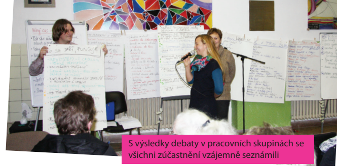
S výsledky debaty v pracovních skupinách se všichni zúčastnění vzájemně seznámili

Cílem veřejné diskuse bylo společně pojmenovat a pochválit to, co funguje výborně, popsat problémy a nedostatky, se kterými se občas potýkáme, a diskutovat o tom, co by přispělo k ještě lepšímu trávení volného času v Týnci. Snažili jsme se nezapomenout na nikoho, od předškolních dětí po seniorky a seniory, mluvili jsme o sportovním vyžití, o milovnících kultury, výstav, divadla a hudby, o nejrůznějších akcích, festivalech a soutěžích, které se v Týnci konají. Vznikl seznam aktivit, které by mohly přispět k ještě lepší volnočasové nabídce. Diskuse probíhala nejprve v plénu a pak v pracovních skupinách, které se věnovaly čtyřem tématům: Jak město podporuje volnočasové aktivity (různé způsoby podpory ze strany města s důrazem na ty nefinanční); Prostory pro volný čas (jaké vybavení je v Týnci k dispozici uvnitř i venku, co vyhovuje a co by se mělo zlepšit); Akce – propagace – spolupráce (v Týnci probíhají nejrůznější festivaly, sportovní akce, koncerty apod. – jak je koordinovat, propagovat, co změnit); Mají všichni stejnou příležitost? (trávení volného času v Týnci pro všechny lidi od nejmladších po nejstarší a pro ty, kdo nejsou organizováni v klubech či spolcích). Na závěr jsme konstatovali, že vzniklo mnoho námětů, se kterými je třeba dále pracovat; vedení města, kulturní a sportovní komise a zúčastněné spolky zváží, jak na veřejnou diskusi navázat. Účastníci/ice na veřejné diskusi ocenili zejména otevřenou debatu, kvalitní řízení diskusí