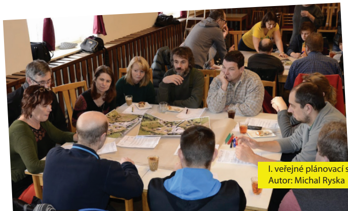
I. veřejné plánovací setkání – práce ve skupinách Autor: Michal Ryska

Druhé veřejné plánovací setkání se konalo v neděli 24. 1. a mělo být vyvrcholením celé akce. Oproti očekáváním se však dostavilo jen asi 30 účastnic a účastníků. Cílem tohoto setkání bylo ohodnotit vzniklé varianty. Nejdříve jsme všechny tři varianty společně odprezentovali. Poté se vytvořily tři pracovní skupiny, v nichž se hodnotily jednotlivé varianty na základě pozitiv a negativ. Nakonec jsme hodnotící výroky bodovali souhlasnými (15) a nesouhlasnými (5) prioritními body. Před formálním ukončením setkání jsme všem vysvětlili další postup projektu, aby věděli, co mají dále očekávat.