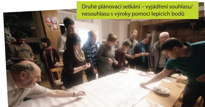
Druhé plánovací setkání – vyjádření souhlasu/nesouhlasu s výroky pomocí lepicích bodů