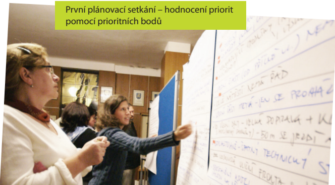
První plánovací setkání – hodnocení priorit pomocí prioritních bodů

Druhým aktuálním tématem byla starostou města iniciovaná potřeba strategického plánu. A to skutečně jako strategického dokumentu sloužícího k domluvě, co opravdu je třeba ve