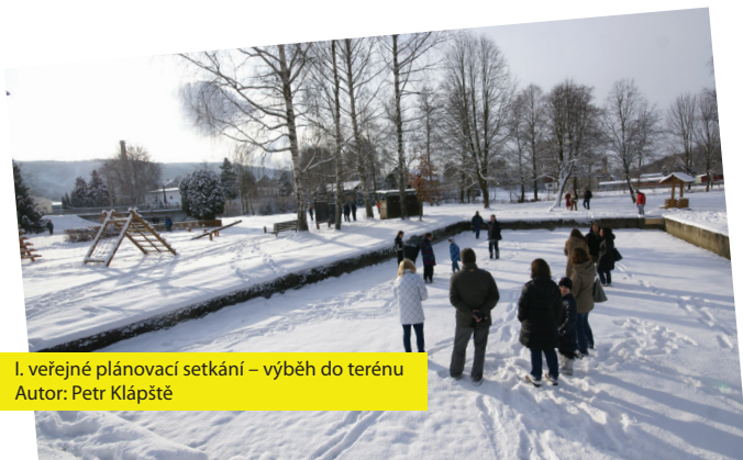
I. veřejné plánovací setkání – výběh do terénu

I. plánovací setkání proběhlo v neděli 17. 1. 2016 od 10:00 ve společenském sále, dorazilo asi 55 účastnic a účastníků. Po úvodních slovech organizátorek a organizátorů, pana starosty a krátkém představení týmu jsme se se všemi přítomnými vydali na procházku do terénu. Společně jsme si prošli řešené území, účastnice a účastníci měli možnost poukázat na problémy i hodnoty místa. Na závěr pak byli vyzváni, aby se postavili na místo, které mají na návsí nejraději, kde si myslí, že je největší problém a kde tráví nejvíc času. Každá z pozic byla zdokumentována fotografem. Toto cvičení týmu posloužilo jako prvotní osahání místa a seznámení se s účastnicemi a účastníky, pro něž to mělo význam v tom, že si vzájemně vizuálně představili svůj vztah k místu a začali o něm mezi sebou a s námi mluvit.