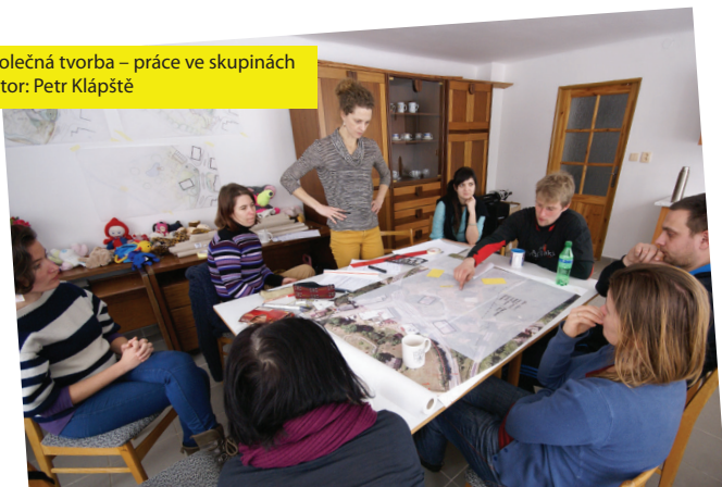
Společná tvorba – práce ve skupinách Autor: Petr Klápště

Dynamika v obou skupinách byla výrazně odlišná. První strávila hodně času v diskuzích a polemikách, ale poté, co počáteční obtíže překonala, zakreslila dvě relevantní řešení, která byla opravdu výsledkem společného myšlení a tvorby.